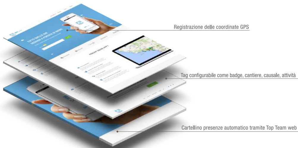
Registrazione delle coordinate GPS

Lo smartphone, tramite l'installazione di Squid, diventa lo strumento indispensabile per il controllo e la gestione del personale fuori sede. Lettura di tag NFC (se il telefono è dotato di chip NFC) È possibile gestire un numero qualsiasi di dispositivi, ciascuno configurato tramite un portale web in maniera indipendente.